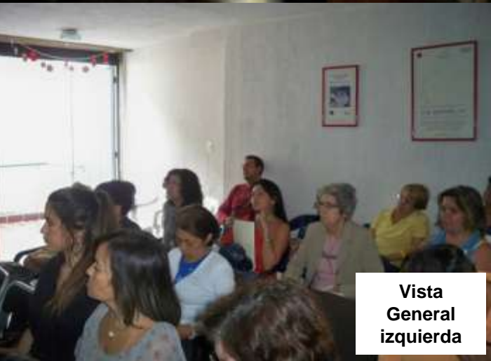
Vista General izquierda