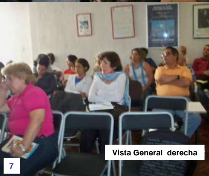
Vista General derecha